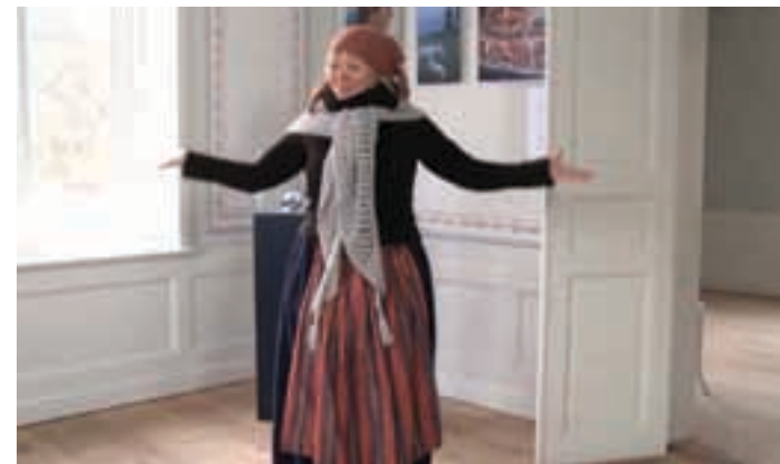
Fredriksdals museum och trädgårdar